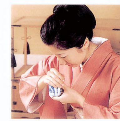
香りを聞いているところ

香道とは、茶道や華道とともに日本に生まれた香りの文化のこと。「においを問ひ、答えを聞く」という考えから、香道ではにおいをかくことを香りをまき(聞く)というよ。香道で使われる香木は自然の中で長い年月を経てできる、とても高価で貴重なものだよ。