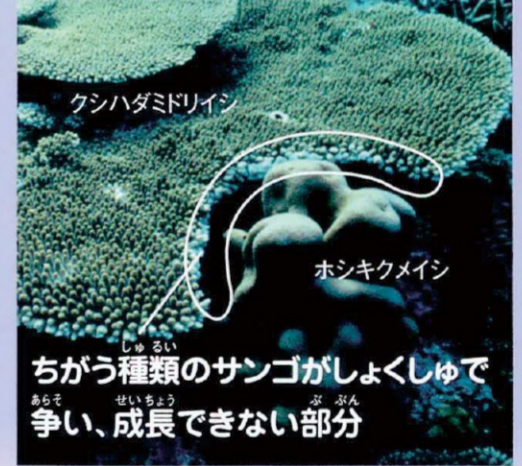
ちがう種類のサンゴがしょくしゅで争い、成長できない部分

昼間は植物のおとなしいサンゴだけれど、夜は自分が成長する場所を求め、激しく戦っているよ。サンゴ同士でしょくしゅの毒を使って戦ったり、自分の体が太陽の光をささげり、相手の成長をふせいだりするんだ。