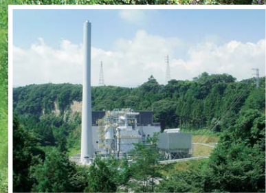
木質チップだけを使って発電する発電所(群馬県:香妻木質バイオマス発電所)

日本にはおよそ400カ所のバイオマス発電所があって、その発電量や数もどんどん増えているんだって。代表的なものは、木質バイオマス発電だよ。間ばつ材や使われない木材を細かくした木質チップを使って発電するんだ。