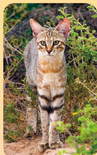
野生のリビアマナコ

私たちがいっしょに暮らしているネコは、「イエネコ」という種類の動物だよ。イエネコの祖先は、今もアフリカなどにいる、野生のリビアマナコ。農作物を食べてしまうネズミをつかまえてくれるので、人が食べ物をあたえて飼うようになり、いっしょに暮らすようになったといわれているよ。