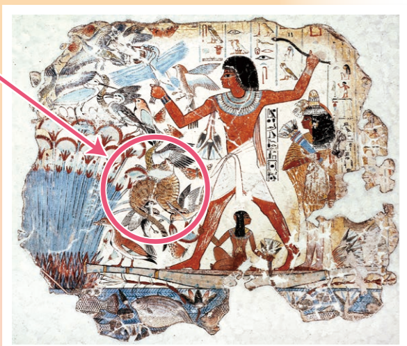
古代エジプトの壁画

私たちがいっしょに暮らしているネコは、「イエネコ」という種類の動物だよ。イエネコの祖先は、今もアフリカなどにいる、野生のリビアマナコ。農作物を食べてしまうネズミをつかまえてくれるので、人が食べ物をあたえて飼うようになり、いっしょに暮らすようになったといわれているよ。