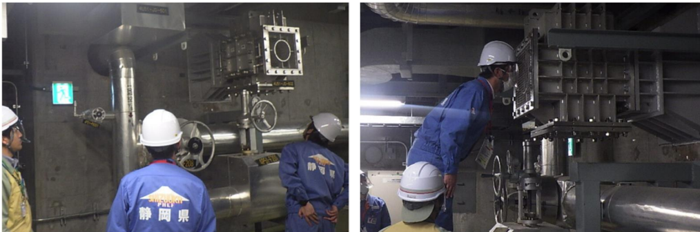
追加で設置した浸水防止ダンパの点検の様子

注 1 自主的に取り組んできた重大事故対策や、2013 年 7 月に施行された原子力規制委員会の新規規制基準を踏まえ追加した対策工事などのことです。