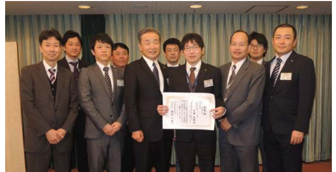
全社技術研究発表会ステージ発表の部 最優秀賞