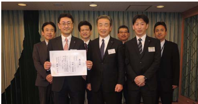
全社技術研究発表会ポスターセッションの部 最優秀賞