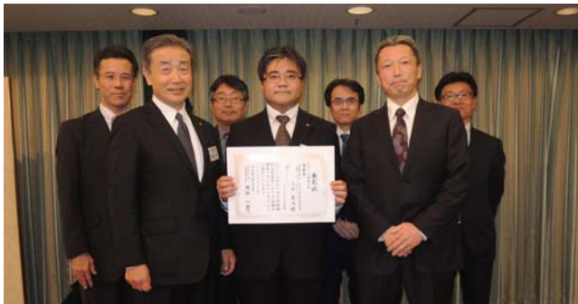
全社技術研究発表会ステージ発表の部 優秀賞