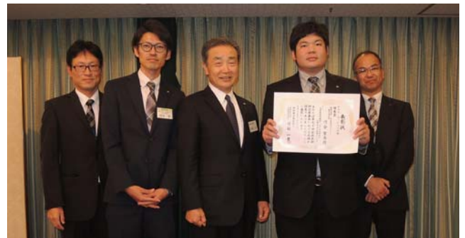
全社技術研究発表会ポスターセッションの部 優秀賞