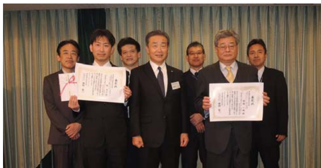
技術研究開発 社長賞