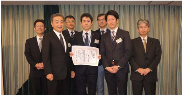
全社技術研究発表会ステージ発表の部 最優秀賞