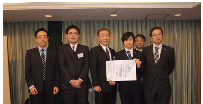
技術研究開発 本部長賞