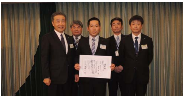
全社技術研究発表会ポスターセッションの部 優秀賞