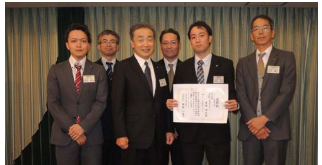
全社技術研究発表会ステージ発表の部 優秀賞