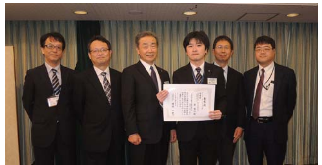
全社技術研究発表会ポスターセッションの部 優秀賞