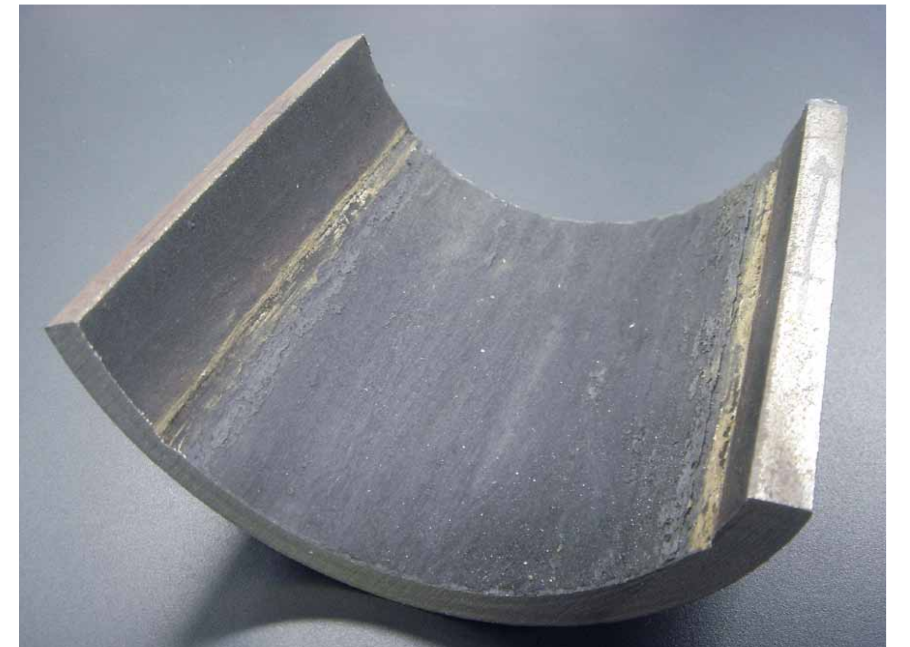
スケールが付いた配管（切断したもの）