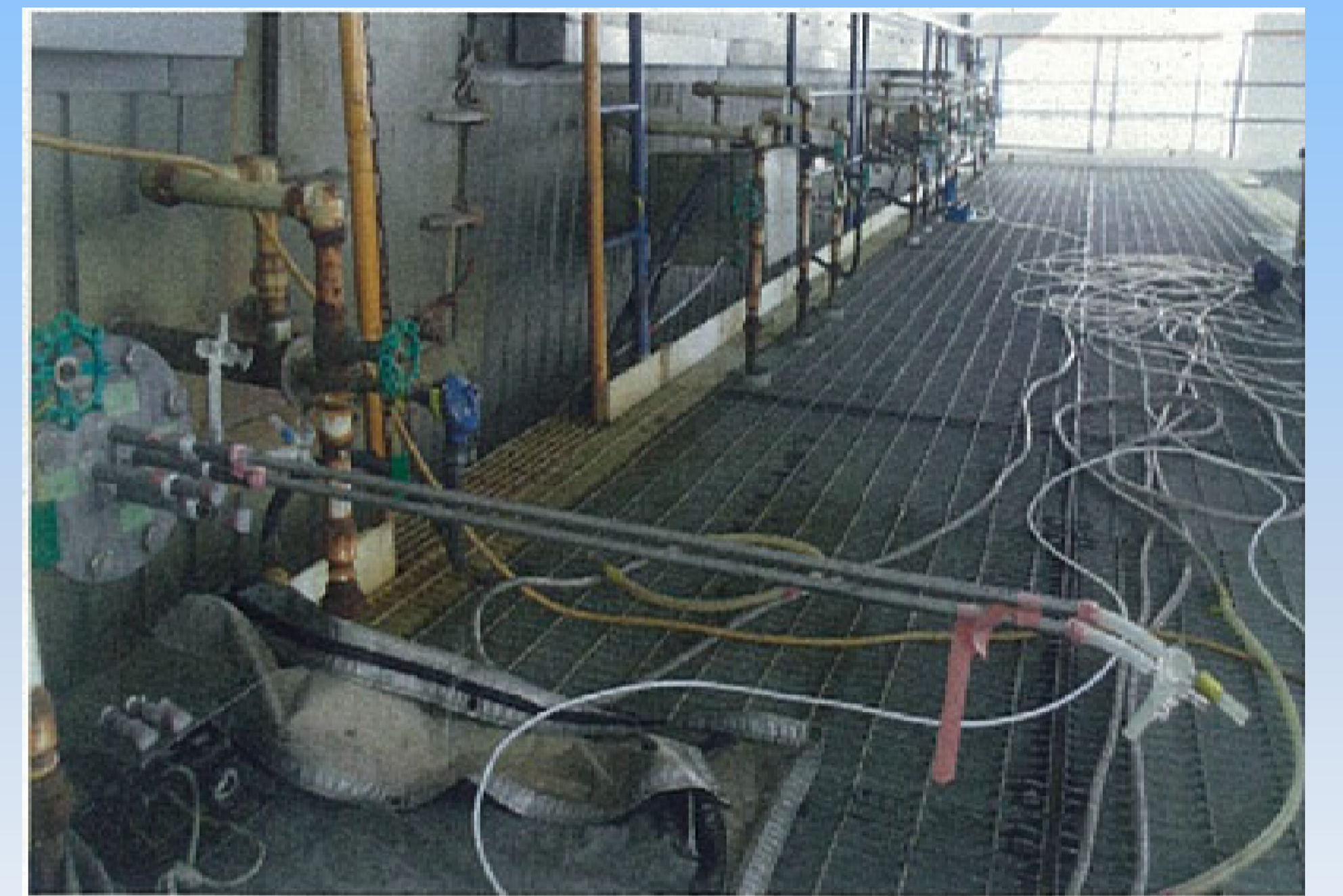
アンモニア濃度測定状況