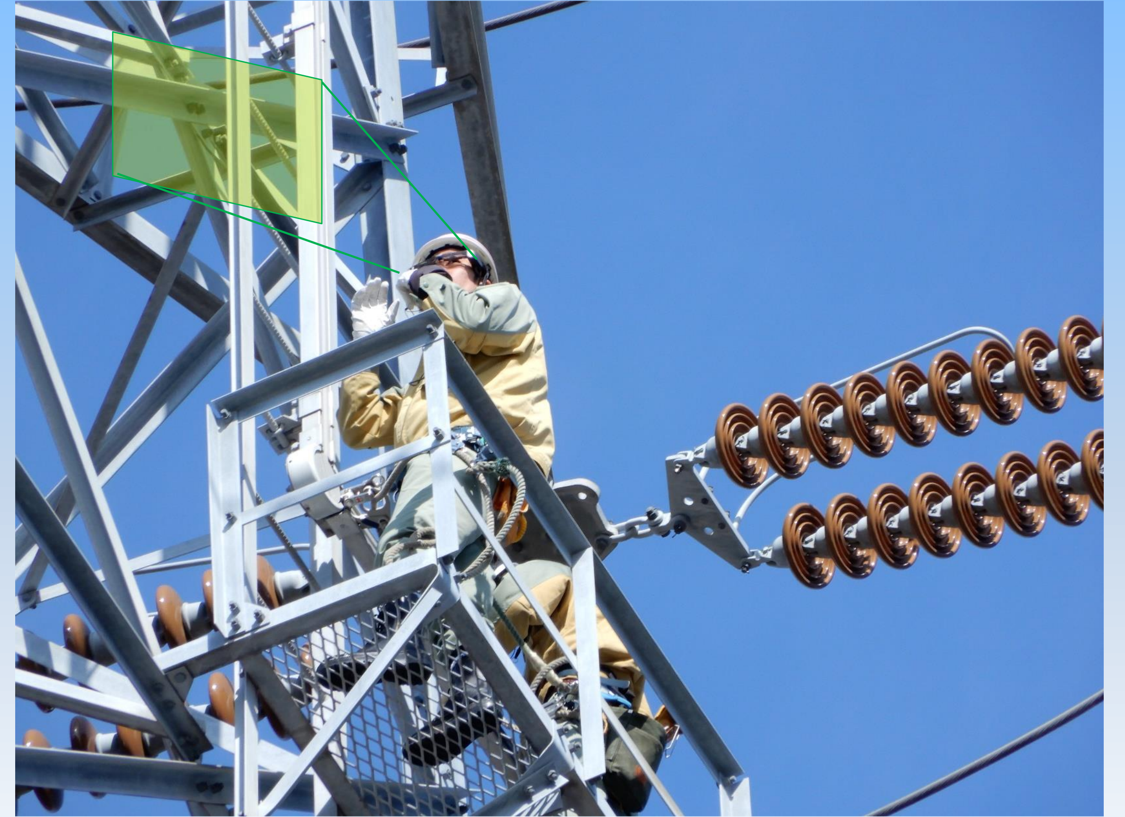
① 現場と事務所の遠隔通信システム