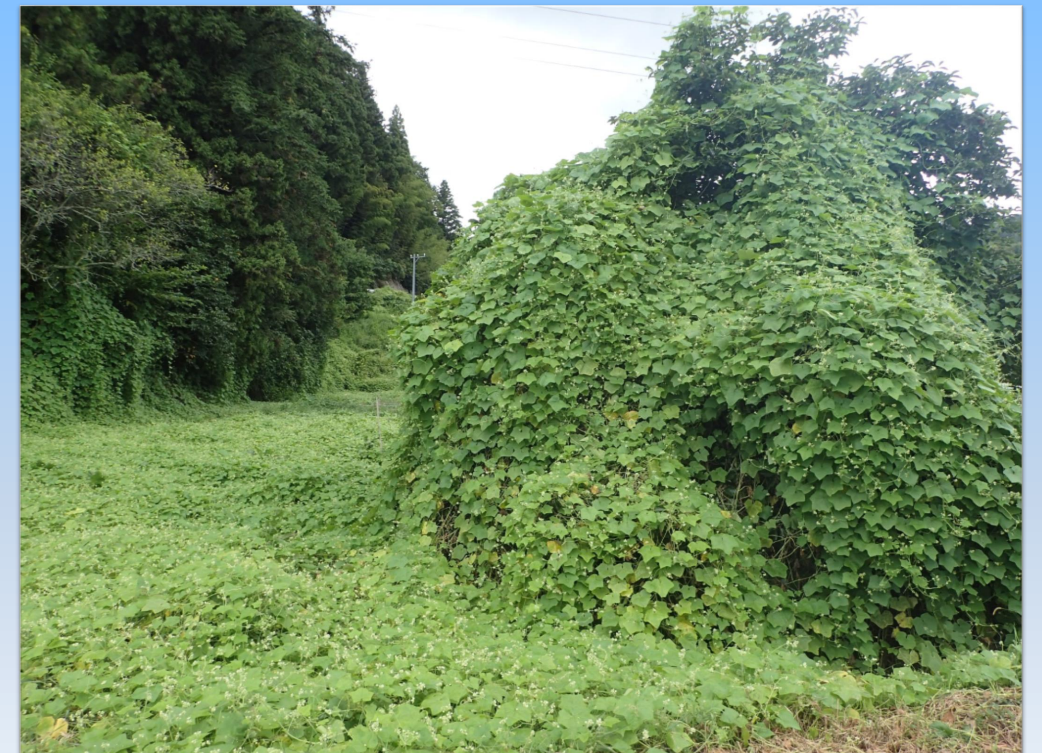
地面も樹木も覆い尽くすアレチウリ