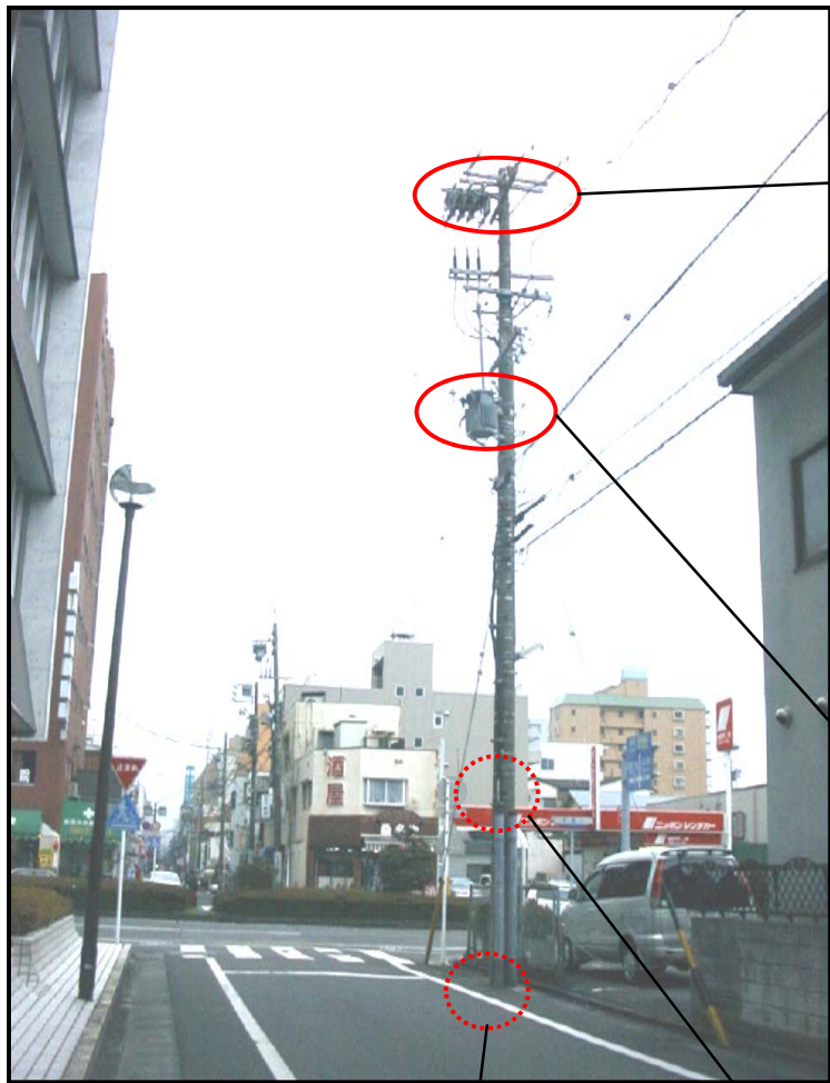
○電柱上部の開閉器の上に作られた営巣