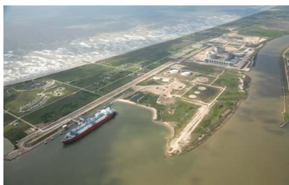
既設 LNG 受入基地