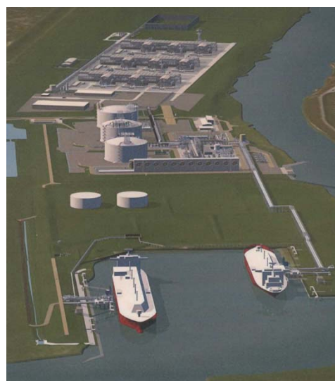
輸出基地完成イメージ図