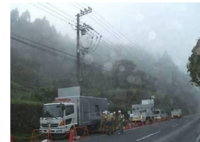
（高圧発電機車による電源確保）

災害対策拠点（行政・警察・消防）等への早期電源確保を目的に高圧発電機車を全営業所に配備