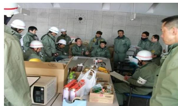
（動員後の打合せ風景）