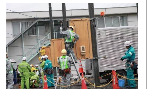
（10電力合同訓練における訓練風景）

「配電技術力の維持・向上」「高度化する業務に的確に対応できる人材の育成」を目的に1986年から継続して実施（ 今年は11月8日に開催 ）