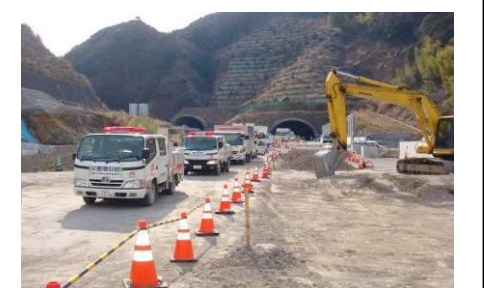
（東北地方太平洋沖地震への応援部隊）