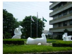
【その他】研究所設立50周年記念展示