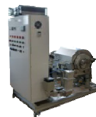
【電気利用】マイクロ波を利用したコーヒー豆の焙煎