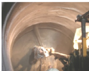
【土木】石炭灰を利用した高強度吹付けコンクリート