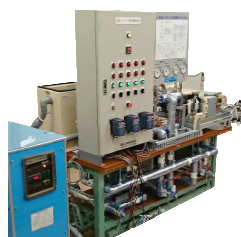
【電気利用】地球温暖化影響の少ない冷媒を使用した高温ヒートポンプ