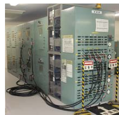
【流通】ミニチュア電力系統設備