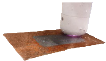
【原子力】レーザー除染技術