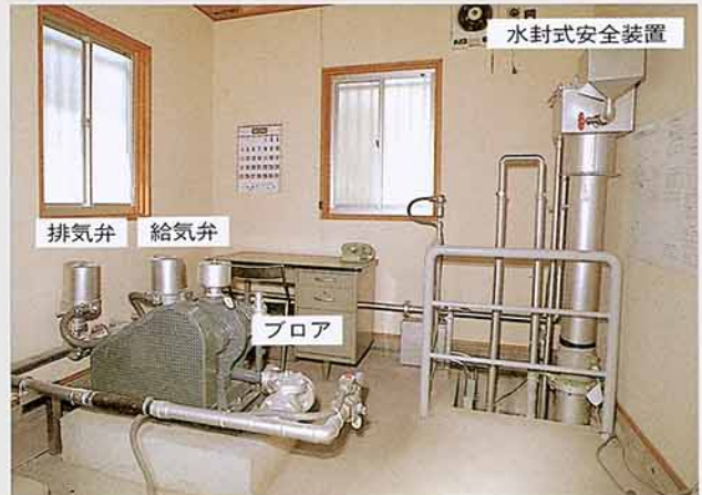
第4図 ダムの操作機構