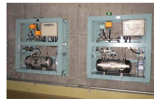
泡消火装置の設置例