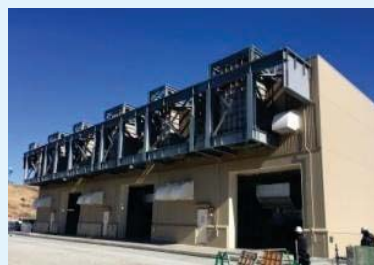
ガスタービン発電機建屋