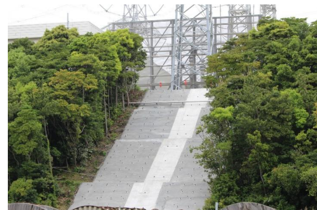
斜面補強工事完了後の様子