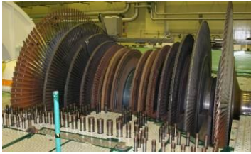
タービンロータ1本の写真