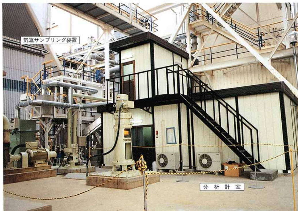
第1図 試験設備設置場所

石炭灰処理は4時間周期で行われており、一旦中継サイロに貯蔵し、その後灰貯蔵サイロに移送している。