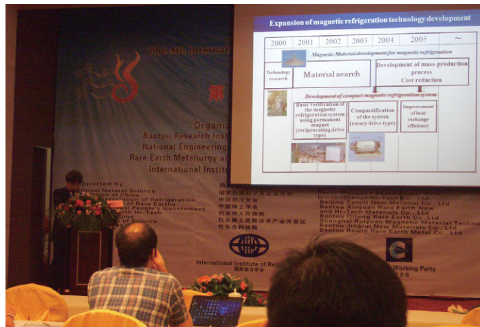
講演の様子(多くの質問が寄せられました)

冬には氷点下20℃にもなる内陸部も、夏は清々しい気候が続き、日本では味わうことのできない食べ物や文化にも触れることができ、知らない世界の多いことに気づかされました。今回の経験を今後の研究に役立たせ、開発が一層推進することを期待します。