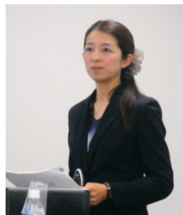
津田その子研究副主査： 外来植物対策の取り組み について