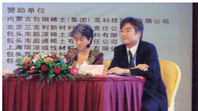
フランスの研究者とともに座長を務める平野研究主査(右)