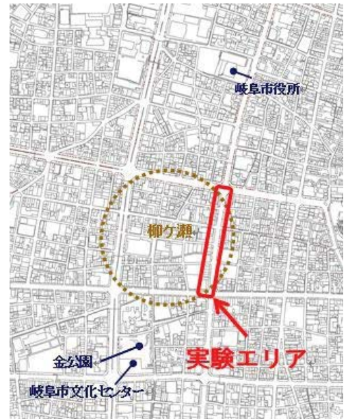
実証実験の予定場所

この他、お役立ち情報として、ニュースや天気予報の他、協賛企業の広告等を発信する。