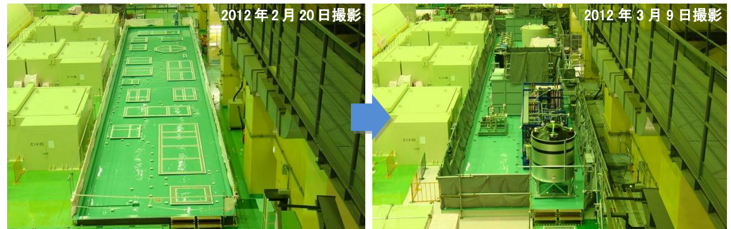
漏えい拡大防止(堰)の設置