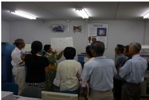
<放射線測定施設での説明の様子>