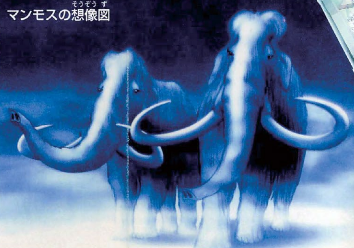
マンモスの想像図