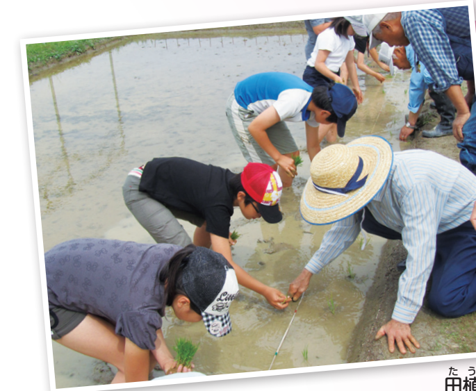
1年生「季節を楽しもう」 2年生「野菜を育てよう」 3年生「おじいさん、おばあさんから学ぼう」 4年生「私たちにできるエコ活動しよう」 5年生「お米を育てて植物の命をつなごう」 6年生「アートマイルで世界とつながろう」

身近にできることから活動している小学校がたくさんあるよ。その中から、2つの小学校をしようかいるよ。自分たちが活動するときの参考にしよう!