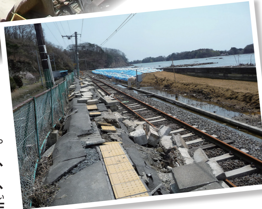
東日本大震災 陸前富山駅の被害の様子

災害を防ぐ取り組みや身を守ることを「防災」というよ。特に気をつけなくてはいけないのは、地震、台風、大雨、雷などによる自然災害。いつ起きるかわからないので、ふだんから防災の備えをして、防災を意識しながら生活することが大切だよ。