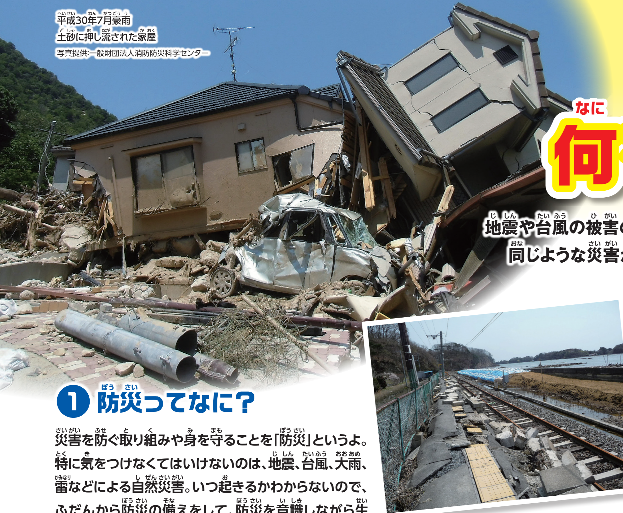
平成30年7月豪雨 土砂に押し流された家屋