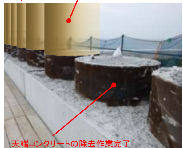
＜西側端部嵩上げイメージ図＞