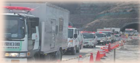
緊急開口部の活用