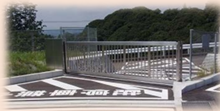
復旧拠点となるスペースの提供