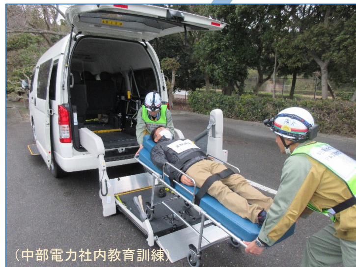
(中部電力社内教育訓練)