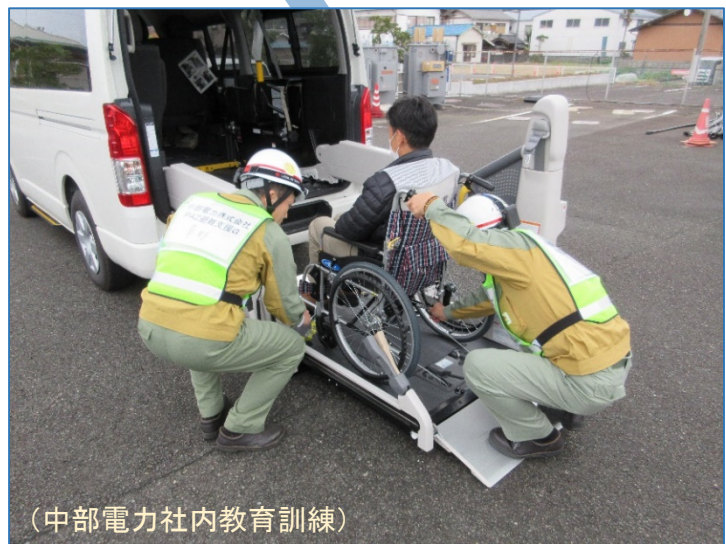
(中部電力社内教育訓練)