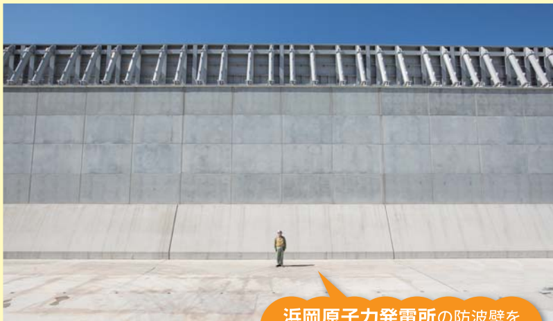
浜岡原子力発電所の防波壁を間近でご覧いただけます!

※都合により見学先を変更または中止とさせていただきます。 ※解散予定時刻は、道路事情等により変更となる場合がございますので、ご了承ください。また、上記の集合・解散場所以外での集合・解散はご遠慮願います。 (注)名城変電所では、ペースメーカーを装着されている方は見学できません。