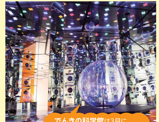
でんきの科学館は3月にリニューアルオープンしました!