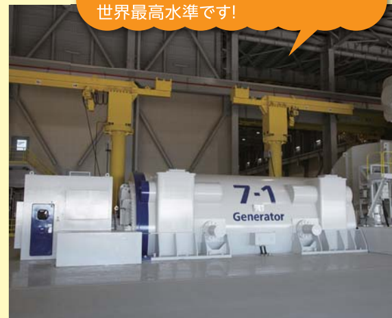
西名古屋火力発電所の発電効率は世界最高水準です!