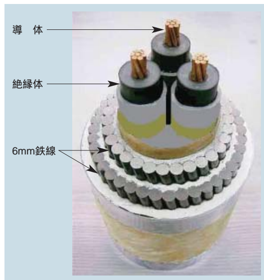
第2図 6.6kV 3×60mm 2 CV二重鉄線外装海底ケーブル