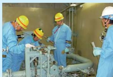
機器単位の点検の様子