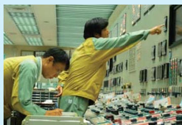
系統単位の点検の様子

これまでの点検等の結果では、安全上重要な設備の機能に影響を及ぼす損傷は確認されておりません。現在進めている原子炉の停止中における点検が終了した後は原子炉を運転して、引き続き機器や系統の機能を点検してまいります。