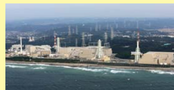
■浜岡原子力発電所

当社は、今後とも地域のみなさまに信頼していただける原子力発電所を目指し、「安全最優先」と「情報公開の徹底」に努めてまいります。これまで同様、みなさまのご理解とご協力をお願い申し上げます。