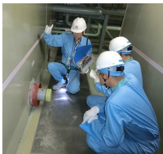
補給水系などの注水配管の追設 点検の様子

※自主的に取り組んできた重大事故対策や、2013年7月に施行された原子力規制委員会の新規制基準を踏まえ追加した対策工事などのことです。