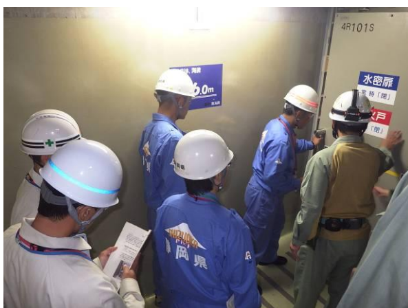
建屋外壁扉への自動閉止装置の設置工事点検の様子

また、静岡県から、「8月度は、8月25日に点検実施予定である。」旨の連絡がありました。