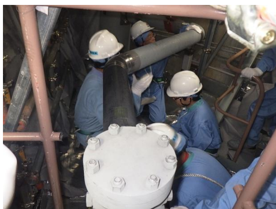
補給水系などの注水配管の追設 点検の様子

※ 自主的に取り組んできた重大事故対策や、2013年7月に施行された原子力規制委員会の新規規制基準を踏まえ追加した対策工事などのことです。