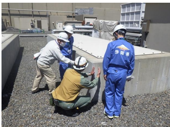
地下配管ダクト点検口・入口扉等閉止 点検の様子

御前崎市から、「対策工事が着実に進んでいることを確認した。安全を第一に、ハードだけではなくソフト面の対策も確実に実施して欲しい。」との講評をいただきました。