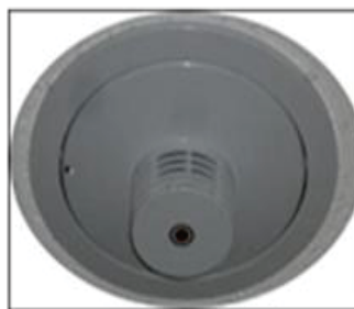
熱感知器(イメージ)