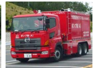
可搬型取水ポンプ車 (タイヤ型)