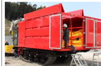
ホース車 (クローラ型)