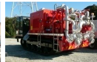
可搬型注水ポンプ車 (クローラ型)