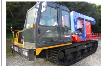
可搬型取水ポンプ車 (クローラ型)