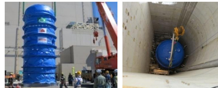
フィルタベント設備設置時の様子