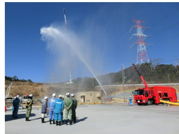
放水砲訓練の様子