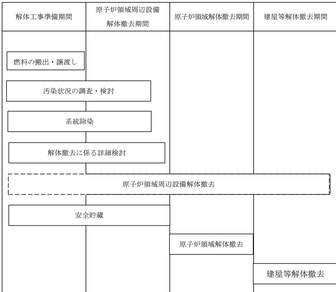
図15 想定廃止措置工程

3号炉の廃止措置は、『原子炉等規制法』に基づく廃止措置計画の認可以降、解体工事準備期間、原子炉領域周辺設備解体撤去期間、原子炉領域解体撤去期間、建屋等解体撤去期間を経て、段階的に30～40年程度をかけて廃止措置を進めて行く予定であるが、具体的な工程については、廃止措置を開始するまでに検討し、廃止措置計画に記載し、認可を受けるものとする。想定廃止措置工程を図15に示す。