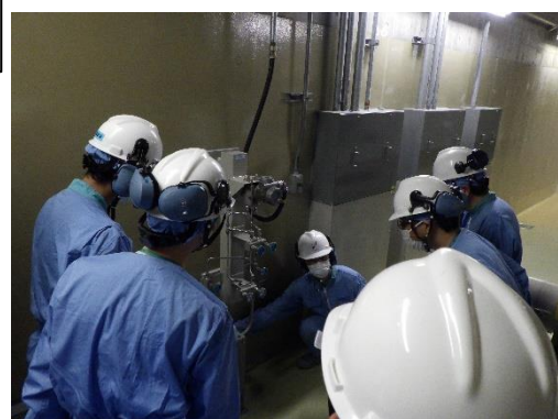
新たに設置した水位計を点検する様子