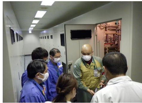
可搬型計測器の配備状況を確認いただいている様子