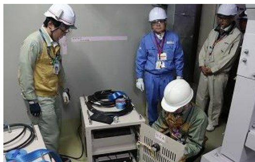
追加で配備した可搬型蓄電池の点検の様子

注 1 自主的に取り組んできた重大事故対策や、2013 年 7 月に施行された原子力規制委員会の新規制基準を踏まえ追加した対策工事などのことです。