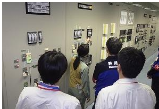
耐震補強を施した記録計を点検している様子

注 1 自主的に取り組んできた重大事故対策や、2013 年 7 月に施行された原子力規制委員会の新規制基準を踏まえ追加した対策工事などのことです。