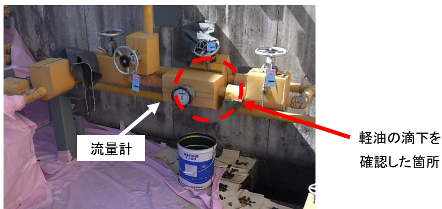
漏えい現場の様子(処置後)