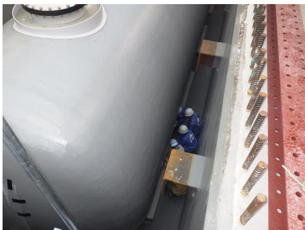
軽油タンク地下化工事点検の様子

また、静岡県から、「12月度は、12月21日に点検実施予定である。」旨の連絡がありました。