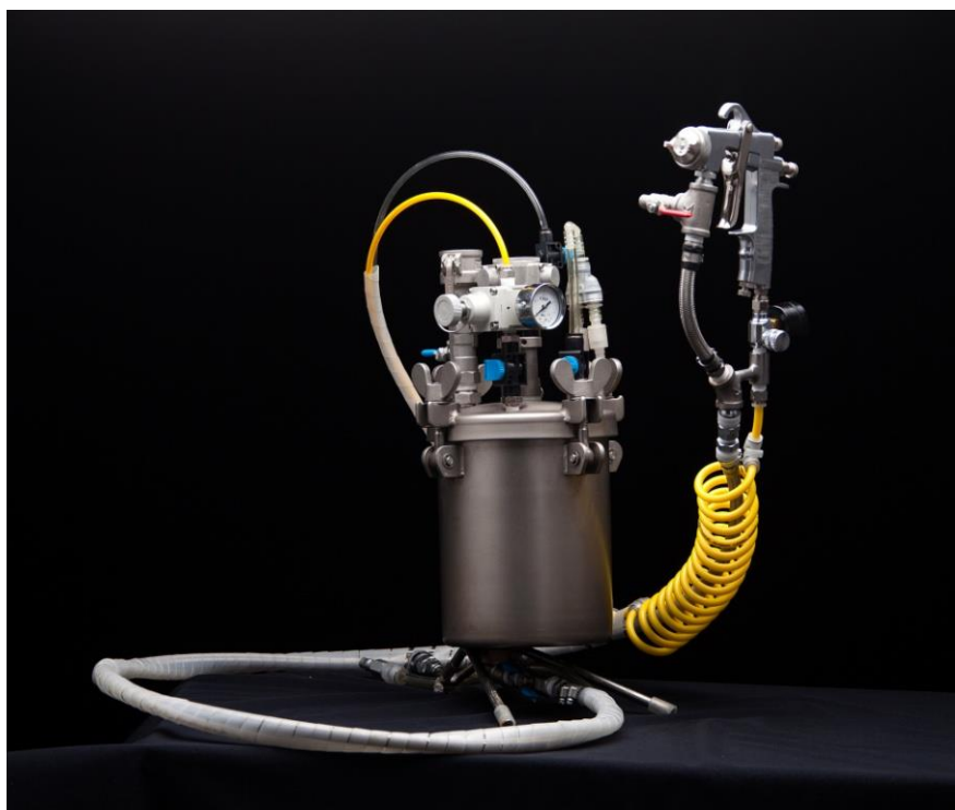
シリコーンゴムスプレー装置