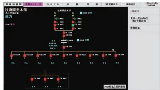
監視制御卓 (SCADA) 画面

配された引出線ごとの最大電流値の記録・Excel出力により巡視業務が効率化された。また、機器故障情報を細分化して通信伝送することで、故障からの復旧が早期化された。このように、当該規格の適用により、安価かつニーズに応じた柔軟なシステム構築が可能となった。なお、中部電力パワーグリッド株式会社は、自社変電所への本システム適用を目指している。