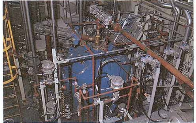
3月から調整試験予定の改質器